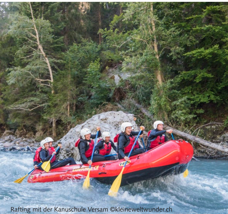
Rafting mit der Kanuschule Versam