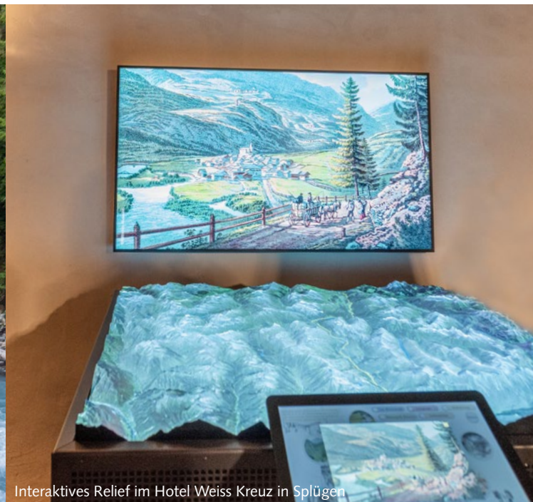
Interaktives Relief im Hotel Weiss Kreuz in Splügen